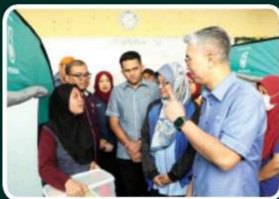
Menteri Miti Santuni Mangsa Bencana Banjir Kota Tinggi