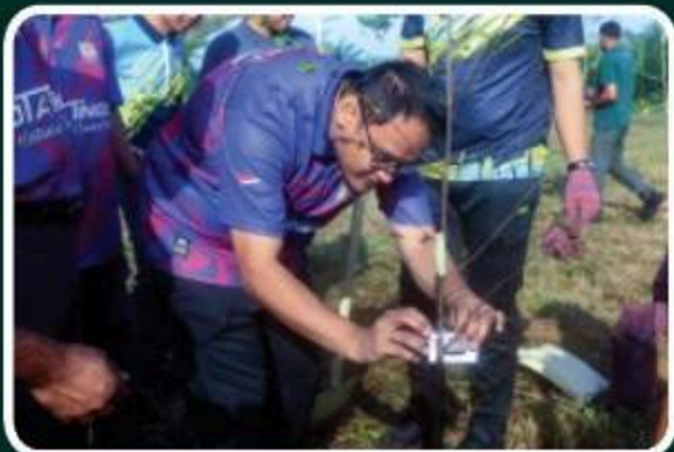
Program Penanaman 180,000 Pokok Sehari Negeri Johor Peringkat MDKT