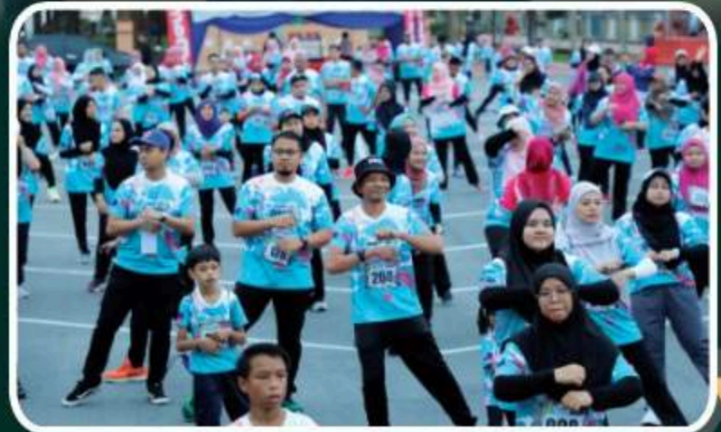
Colour Splash Fun Run MDKT